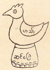
ကျပ်လေးပုံ

ရှေးကျမ်း၌ ပြုအပ်သော လက္ခဏာကို မယုတ်စေမူ၍၊ အဋ္ဌကထာ၊ ဋီကာဆရာတို့အလေးဖွဲ့ပုံ၊ ခေတီဝေတီပုံ အမျိုးမျိုးကို ပြခြင်း မိဿကကျပ်လေးဝါ၊ နီလကဟာပဏော