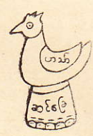
မတ်လေးပုံ